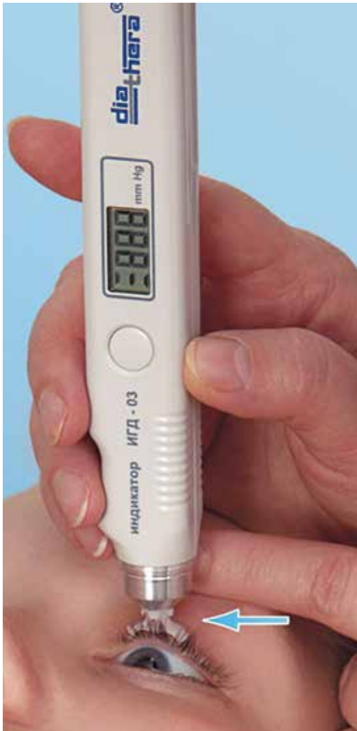
Рис. 1. Правильное положение транспальпебрального тонометра и века пациента при измерении

параметрической статистики: рассчитывали среднее значение, стандартное отклонение, коэффициент корреляции по Пирсону для исходных рядов данных. Для малых выборок использовали показатели медианы и межквартильного диапазона значений.