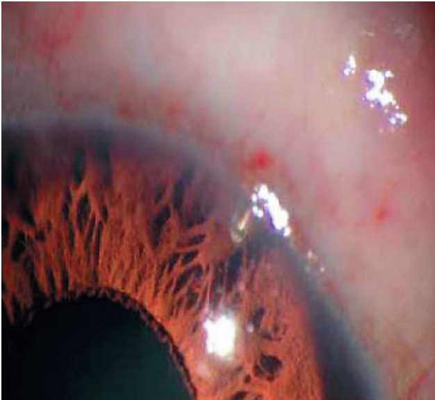
Рис. 1. Мини-шунт Ex-PRESS R-50 через 7 дней после хирургического вмешательства